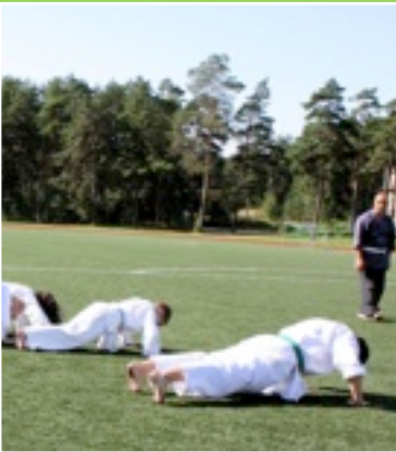
Opi japania ja tutustu samalla paikallisfloraan. Ichi-ni-san-shi...