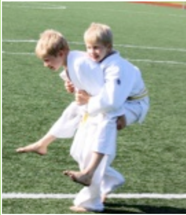
Alkulämmittelyä GBK:n poikien tvvliin.