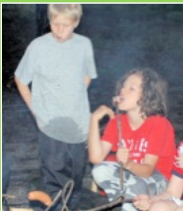
Se (ainoa) hetki päivästä, kun GBK:n pojat olivat hiljaa.